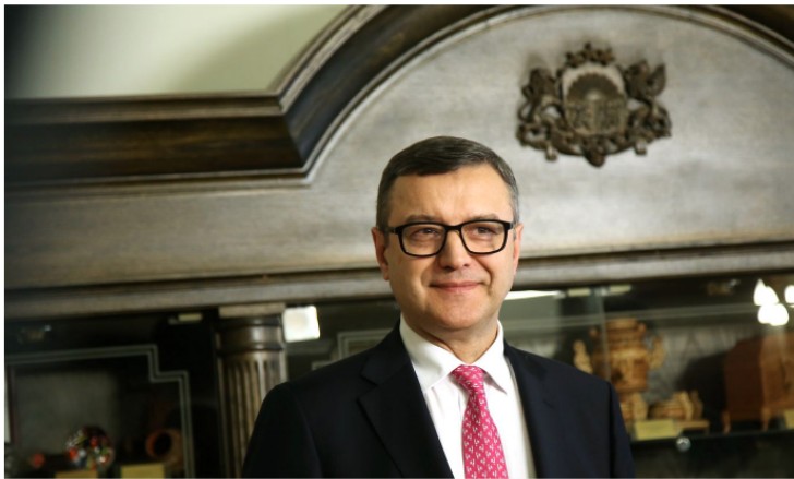
Finanšu ministrs Jānis Reirs

Valsts pētījumu programmai "Ēnu ekonomikas mazināšana valsts ilgtspējīgas attīstības nodrošināšanai" veltīs 251 536 eiro, paredz Finanšu ministrijas (FM) sagatavotais rīkojuma projekts